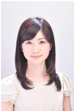
井田寛子(気象予報士)