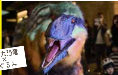
実物大恐竜 × 着ぐるみ