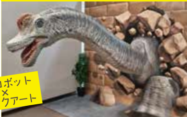
恐竜ロボット × トリックアート