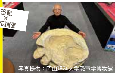
恐竜 × 化石調査