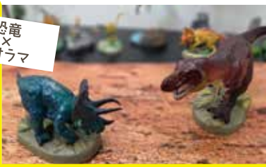
恐竜 × ジオラマ