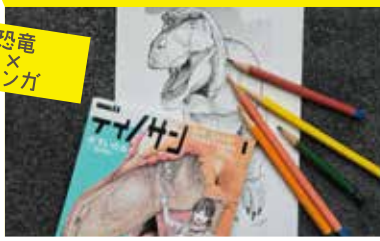
恐竜 × マンガ